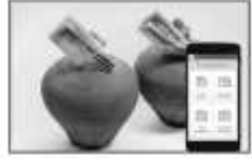
मोबाईल मनी कलेक्शन