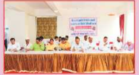
वार्षिक सभेनिमित्त उपस्थित संचालक, सद्गानार मंडळ