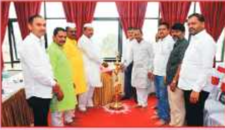
संस्थेच्या २२ व्या वार्षिक सर्वसाधारण सभेवेळी दिपप्रज्वलन करताना संस्थेचे अध्यक्ष, संचालक व सद्गानार मंडळ