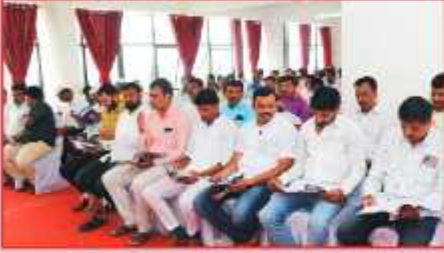
संस्थेच्या २२ व्या वार्षिक सर्वसाधारण सभेनिमित्त उपस्थित सभामंडू बंधू-भगिनी