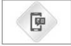
SMS बँकिंग सुविधा