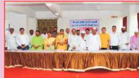
संस्थेच्या २२ व्या वार्षिक सर्वसाधारण सभेस उपस्थित संस्थेचे संचालक सद्गानार मंडळ