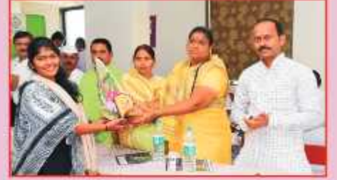
उत्तीर्ण विद्यार्थ्यांचा सत्कार करताना संचालक, सद्गानार मंडळ