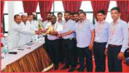
संस्थेच्या चिबळी फाटा व सोडू शाखा उत्कृष्ट कामगिरी केल्याबद्दल सत्कार करताना संस्थेचे संचालक, सद्गानार मंडळ